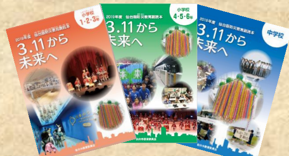
【刊行物「仙台版防災教育副読本」】

センター「要覧」 「センター研修 2020」 「仙台版防災教育副読本 3・11 から未来へ」 「仙台の自然」 「わたしたちのまち仙台」 教育研究紀要 「教育はいま」 教育の情報化研究委員会「活動報告書」 「フレッシュ先生研修ガイドブック」 等