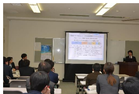
平成 30 年度教育センター長期研修報告会より