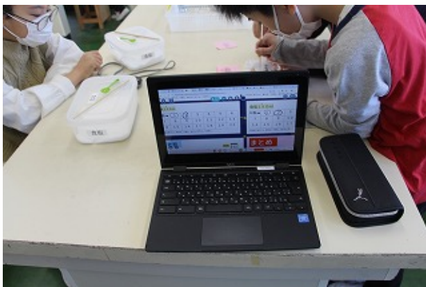
5年 | - | -