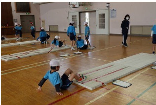
2年 | - | -