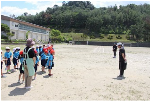
1年 | - | -