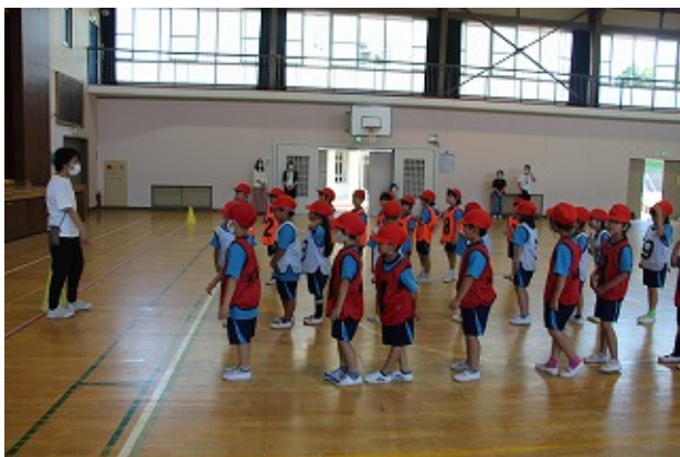
1年 | - | -