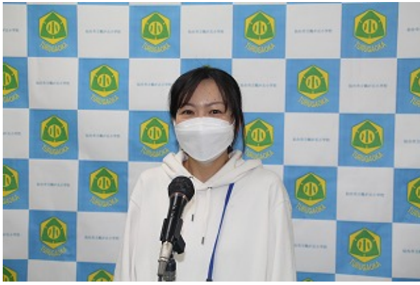
職員室 | - | -