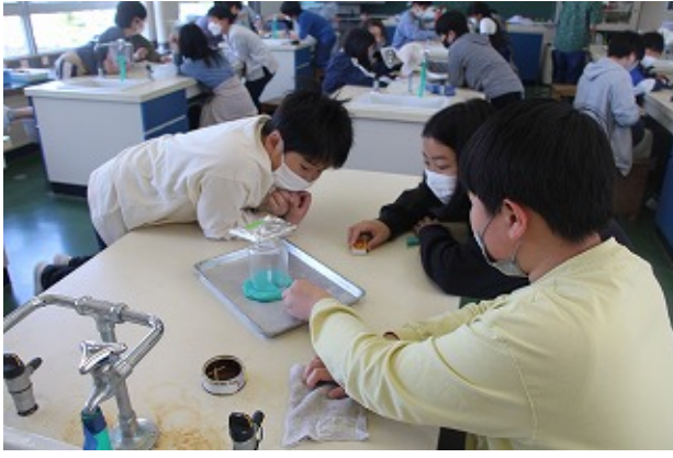
6年 | - | -