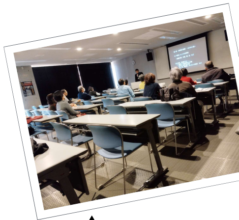
▲ 施設見学のようす ▶