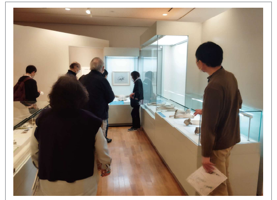
▲ 館内での活動のようす