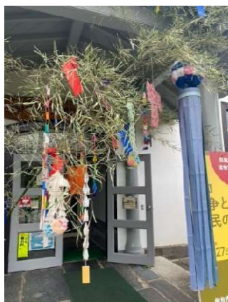
職員手作りの七夕飾りです

当館では、現在、「七夕と盆」の季節展示を行っています。「七夕飾り」は職員の手作りです。榴岡小学校の弟子入り留学で職場体験に来た4年生児童が作った折り鶴もあります。ぜひ、ご覧ください。