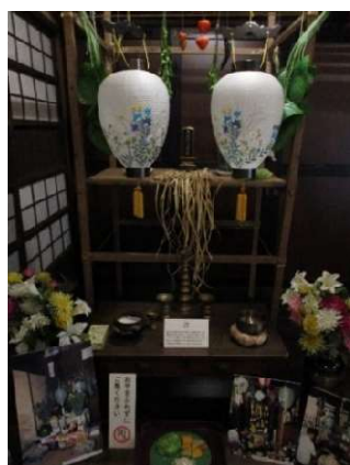
盆棚と盆提灯です

13日～14日には精霊を迎えるため家の前で火（盆火）を焚きますが、道路が舗装されてからは汚れるため行われなくなりました。また、かつては15～16日の精霊送りでは、精霊へのみやげとしてハスの葉やコモ草で盆棚の供物などを包み、川や堀などに流していました。