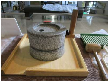
大活躍の「石臼」です

仙台市歴史民俗資料館に勉強に来た小学生から、お手紙をいただきました。 ありがとうございました。ぜひ、また来てください！！