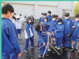
地域合同防災訓練