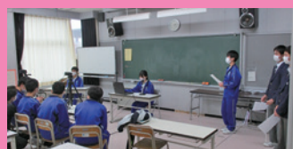
生徒会主体での話し合い活動