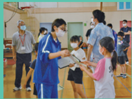
市民センターでのボランティア活動