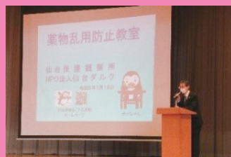
薬物乱用防止教室