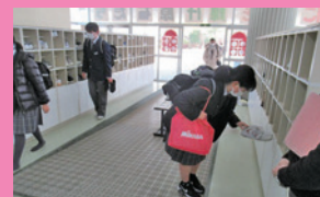
ピンクシャツデー実施