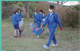
全校一斉地域清掃