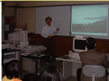
コンテンツの大写し