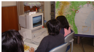
コンピュータを使って調べる