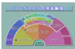
オーケストラの編成