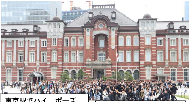
東京駅でハイ、ポーズ

修学旅行のねらいが十分に達成され、たくさんの場面で生徒の笑顔が見られる、とてもよい行事となりました。