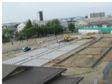
プレハブ校舎の進捗状況