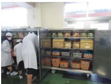
給食係の運搬の様子