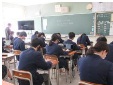
朝学習が静かに行われています