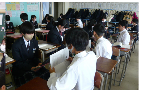
5 組 国語 ペア学習