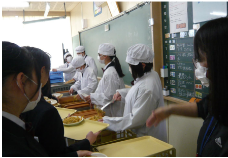
1 組 給食配膳

なお、令和 6 年度の年間行事予定表につきましては、 蒲町中学校のホームページ に掲載しております。御覧ください。