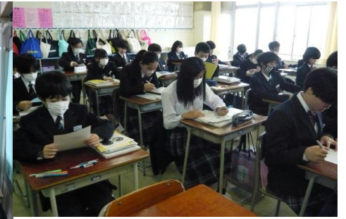
3 組 社会 大陸・海洋調べ