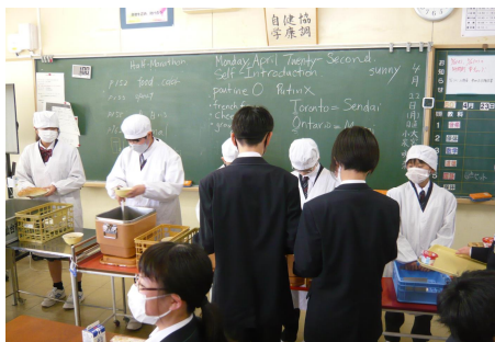
4 組 給食配膳