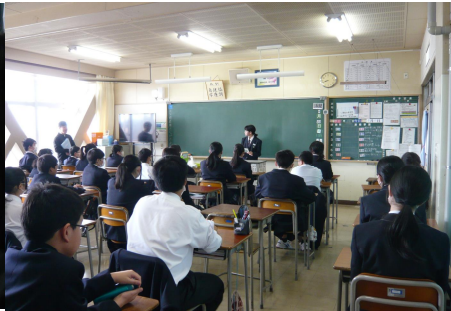
2 組 朝の会