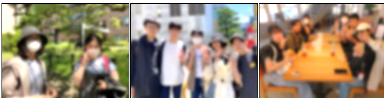
自主研修スタート。盛岡市内をそれぞれのテーマに沿って歩きます。2日目は快晴です！