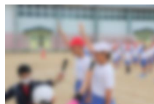
運動会総練習の様子

気温が高くなってくるこの時期、基本的な熱中症対策を継続し、安全第一で教育活動を実施していきますので、保護者の皆様、地域の皆様におかれましては引き続き御理解と御協力をどうぞよろしくお願いいたします。