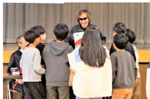
目の不自由な選手の貴重な話を聞いて、バラスポーツを体験