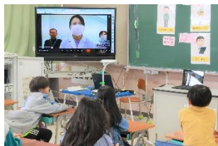
給食センターの所長さんと搬送トラック運転手さんも来校