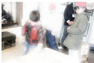
昔の道具や生活について実物や資料で学ぶことができました