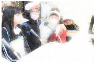
NHK放送局で放送のしくみについて体験しました