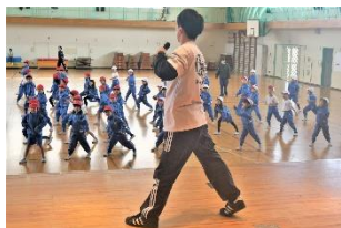
楽しく踊って、たくさん体をうごかしました

6年生は、11月21日にアントレプレナーシップ推進派遣出前授業、12月12日に仙台市教委の自分づくり夢教室を実施し、キャリア教育の充実を図りました。