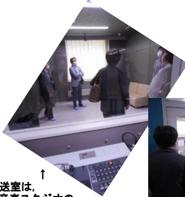
↑ 【放送室は、音楽スタジオのよう…だとも。】