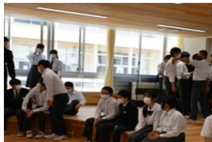
【校舎見学：各フロアにある多目的室