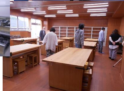
↑ 【協議委員の様子です。様々な意見交換が行われました。】