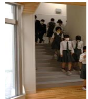
【階段は少し幅が狭めです…】