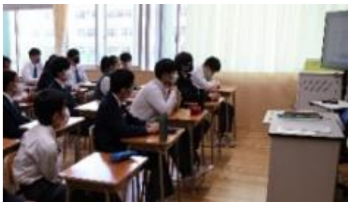
【リモートで行われた移転式：学級での様子】