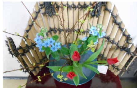
チューリップ ブルースター 等