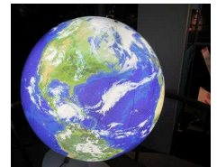
↓仙台市天文台 | 展示されている地球