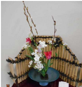
赤目柳 チューリップ スイートピー 等