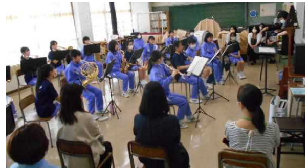
部活動参観の様子(吹奏楽部)