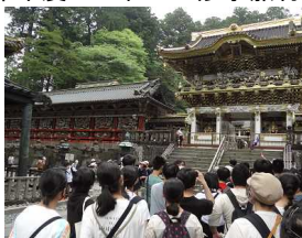
昨年度の3年生の修学旅行(日光東照宮)

参加する生徒の皆さんは楽しみにしていると思います。貴重な体験から学びの多い修学旅行と校外学習となることでしょう。