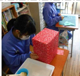
ひかり・ひびき学級 家族へのプレゼント