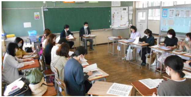
懇談会の様子(野球部)

当日は多数の保護者の皆様に御参加いただき、ありがとうございました。本年度の教育課程や部活動について、お気付きの点等がございましたら中学校へ御連絡ください。