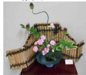
カーネーション ナルコラン 等

【お知らせ2】 公益財団法人加藤山崎教育基金より、加藤山崎奨学金(対象:小5年生・中2年生・高2年生)と加藤山崎修学支援金(対象:小4~6年生・中学生・高校生)募集の案内がありましたのでお知らせいたします。詳しくは、公益財団法人加藤山崎教育基金のホームページの募集要項にて、応募期間や必要書類などを御確認ください。