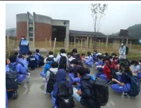
昨年度の1年生の校外学習(旧大川小)