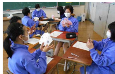
1年数学 トランプによる 加法の学習 (手指消毒実施)