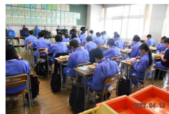
給食:一方向を向いての黙食 (感染拡大防止対策)

【お知らせ1】 学校ホームページ上へ二中全会掲示版を新設しました。二中全会からのお知らせ等に利用します。