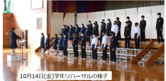
10月14日(金)学年リハーサルの様子

合唱コンクール当日は、感染症拡大防止対策のために保護者の方々の鑑賞はお子様のお学年演奏時のみ（入れ替え制）とさせていただきます。生徒1名につき同居の御家族1名までの入場とさせていただきますが、市民会館大ホールに各学級のすばらしい歌声が響き渡ることを期待しています。