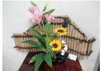
【ユリ・ヒマワリ・スターチス】 【フトイ・カラー・ナデシコ】