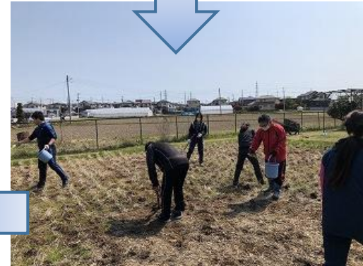
次にぼかし肥料をまきます。(卵を使ったものとEM菌が入ったものの二種類)