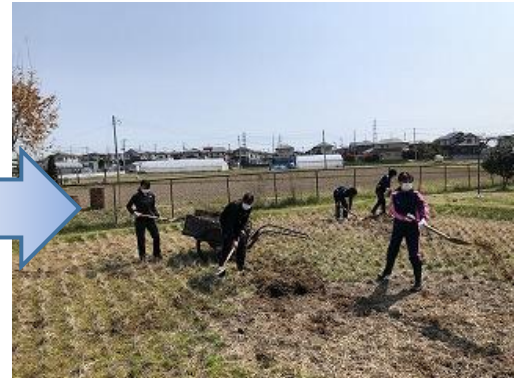
鍬やスコップなどで田んぼ全体に堆肥をまきます。