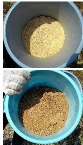
上が卵、下がEM菌のぼかし肥料です。EM菌の方は、ワインやレーズンのような、ほんのり良い香りがしました。