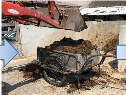
リアカーに積み上げます。(湯気が出るほどホクホクでした！)