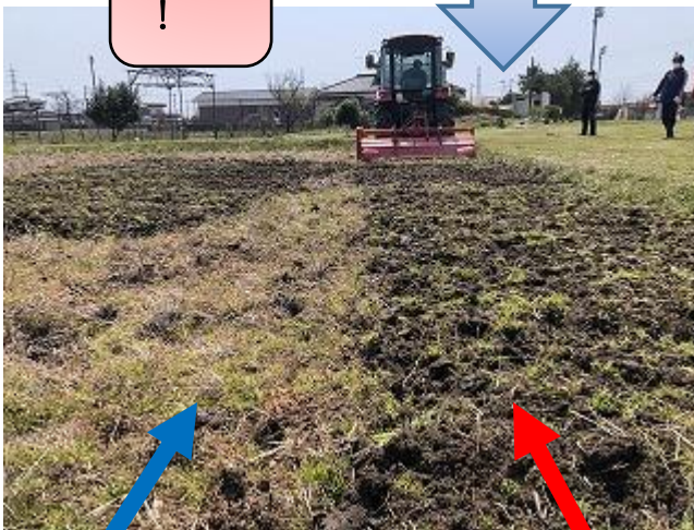
トラクターが通ってない所 トラクターが通った所 土がほぐされていることが分かるかな？