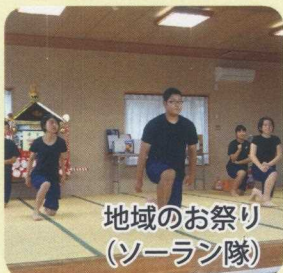
地域のお祭り (ソーラン隊)