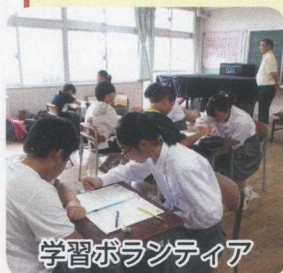
学習ボランティア