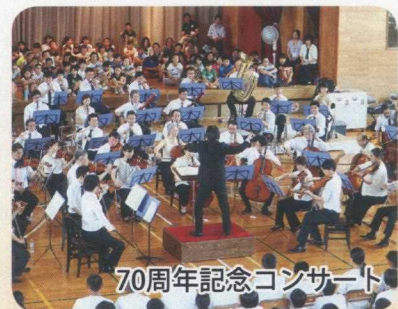
70周年記念コンサート