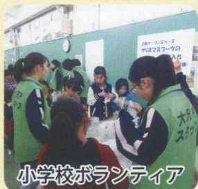
小学校ボランティア