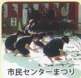
市民センターまつり