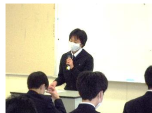
内容も態度も立派な発表でした。

2021年の青陵での授業が本日無事に千秋楽を迎えました。一年を締め括るに当たって、学年集会を開きました。各クラスの代表が、今年の学校生活を振り返り、青陵合格の喜びや新しい生活での困難とそれを乗り越えた後の達成感などを発表しました。教員からは、1年生の旺盛な学習意欲や互いに協力し合う明るい生活態度を褒めました。その上で学習面の葛藤や友人間の衝突があったときにこそ、自分をレベルアップするチャンスと捉え、行動にひとつ新しい変化を起こして前に進んで欲しいという話をしました。クリスマスからお正月へと希望に満ちた日が続きます。この機を捉えて、まずは自分が「 なりたい自分 」をイメージし、その夢に向かって 新しいアクションを実際に起こす冬休み にされるようにと願っております。来年も引き続き、本校の教育活動に御理解とご協力を賜りますようお願い申し上げます。