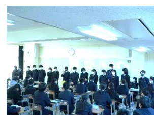
学年集会では2年生で行く野外活動実行委員が紹介されました。