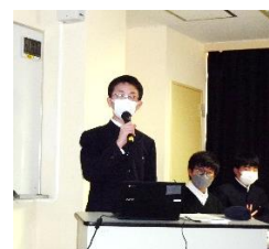
堂々とした分かりやすい発表