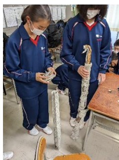
初めての友達と新聞タワー

本校の代表生徒からなる「いじめ防止委員会」が企画した縦割り道徳が全3回にわたって実施されました。1年生から3年生までの混合クラスで、架空のいじめ事件を取り上げ、その原因や解決策などを話し合いました。生徒は 個々が自立した友人関係を築くことの大切さ を学びました。