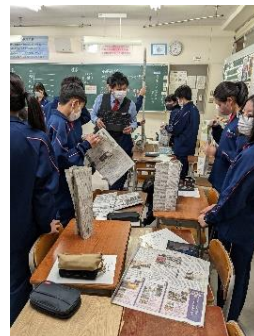
作戦タイムで絆を築く

入学式直後のオリエンテーションでは、学級内の絆を深める目的でPA（プロジェクト・アドベンチャー）を実施しましたが、今月2回の学活ではクラスのメンバーをミックスしてPAを実施しました。「言わずもがな」が通用しない環境でも、 対話を通して課題を遂行する姿 が見られました。