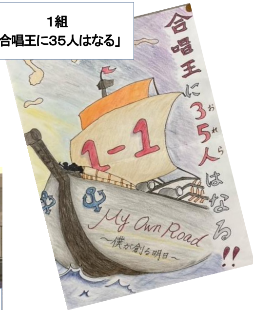
1組 【合唱王に35人はなる】