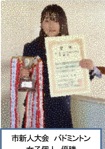
市新人大会 バドミントン 女子個人 優勝