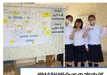
学校説明会での案内係