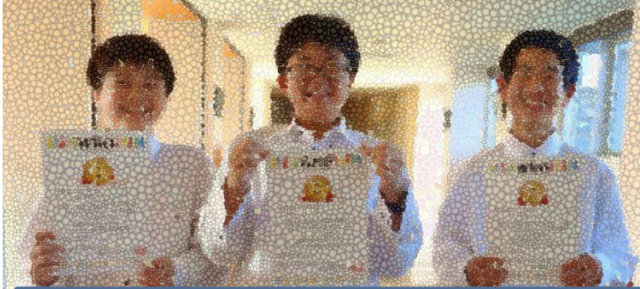
WRO Japan2023 宮城予選会ライトレースタイムトライアル ジュニア部門 第 2 位

1 学期終業式と 2 学期始業式に賞状伝達式がありました。中総体・新人大会(地区大会)では多くの 1 年生も入賞することができました。11 月には県新人大会が控えています。練習の成果を存分に発揮して下さい。