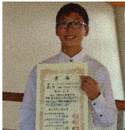
市新人大会 陸上 中学 1 年男子 100M 第 6 位