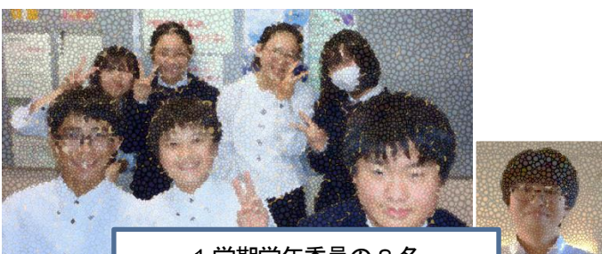
1 学期学年委員の 8 名

2 学期学年目標「落ち着いて行動し、充実した学校生活を送ろう★授業中と休み時間のメリハリをつける。★時間厳守。」