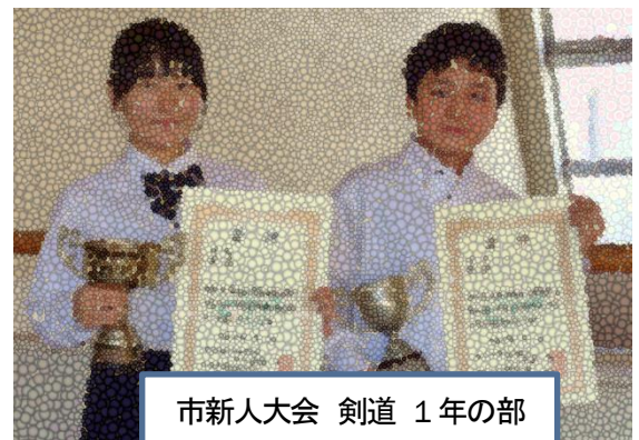
市新人大会 剣道 1 年の部 男子個人・女子個人優勝