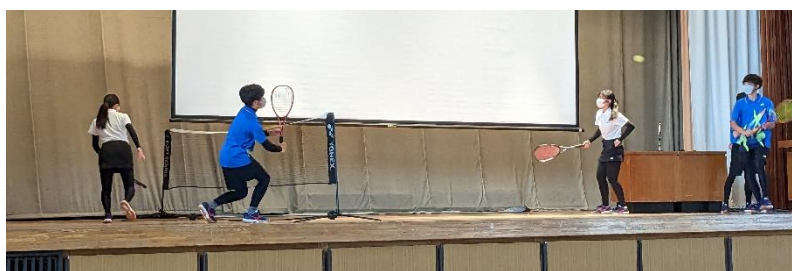
テニス部の皆さん