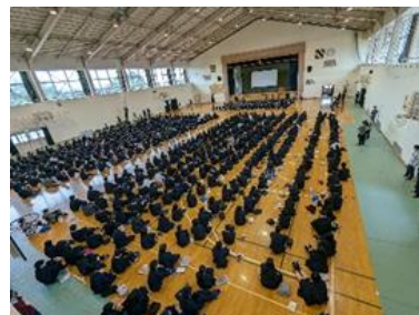
800余名の整列は圧巻です