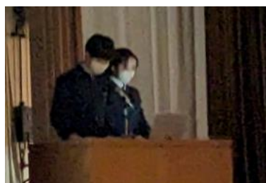
執行部による説明