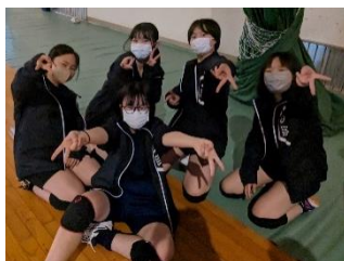
発表前の バレー部の皆さん