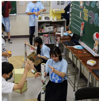
どのクラスも大盛況でした！運営も工夫されていました