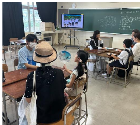
有志生徒が青陵の生活などについて質問に答えるコーナーの様子