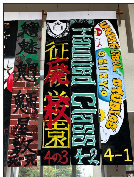
4年各クラスの横断幕 どれもすばらしい出来でした