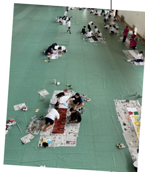
体育館で横断幕作成の様子