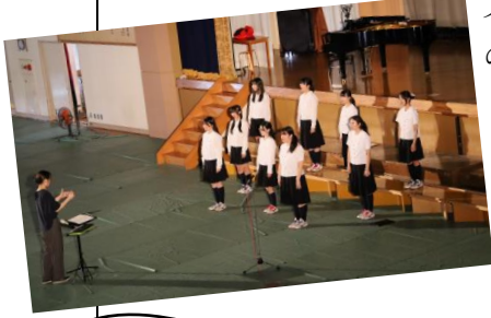
文化部校内発表の様子