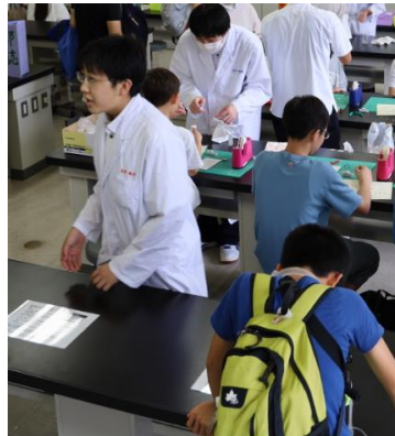
科学部にも多くの小学生が来ていました