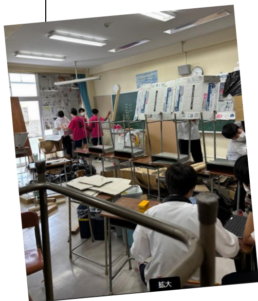
各クラス準備の様子 教室内だけではなく、廊下も装飾中