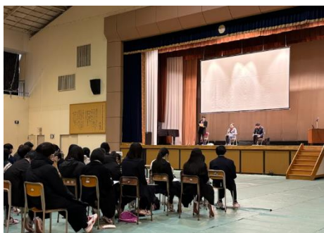
宮城教育大学の先生から講評をいただきました

また、今日の発表会の中で、宮城教育大学の先生方から、「自分の研究で一番伝えたいこと」や「売り(アピールポイント、独自性)」を何度も質問されていたかと思います。4年生も自分の論文で、アピールポイントや独自性は何かを考えてみましょう。