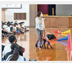
フェニックスプラン講演会