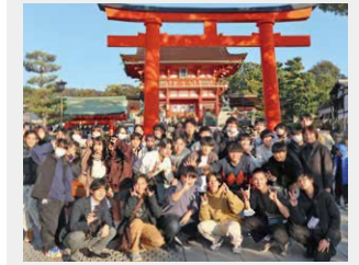
ホームルーム研修旅行