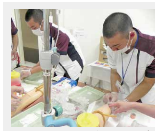
フェニックスゼミスペシャルデー