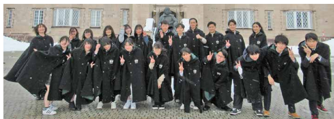
▲ブリティッシュヒルズでの語学研修