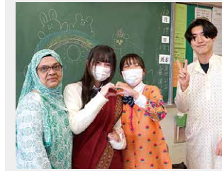
国際理解ホームルーム交流会