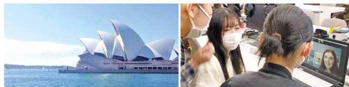
▲オーストラリア、ケリービルハイスクールの生徒とのオンラインによる交流