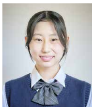
剣道部 3年 キャプテン