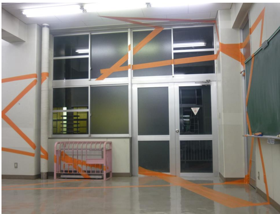
でも、ポジションがずれると……(?_?)