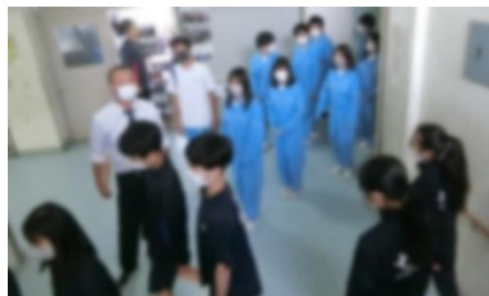
↑ 静かに廊下を移動しています

地域の皆さんと防災についてのお話をしていると、中学生に対する期待の大きさを感じます。実際、自ら考え、周囲と話し合いながらも、率先して動き、人の役に立つことのできる生徒がたくさんいます。訓練で培ったものを、地域のためにも大いに還元してほしいと思います。