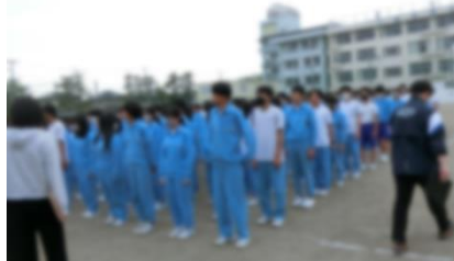
↑ 校庭で整列している様子