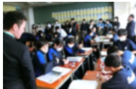
↑ 1-4 保健体育の授業

4月24日(水)に、授業参観が行われました。あいにくの天気の中ではありますが、たくさんの保護者の皆様に、生徒が学習に取り組む様子をご覧いただきました。生徒は、どの学年のどのクラスも、少し緊張しながら、明るく前向きに学習に取り組んでいた様子でした。中学生は、心のどこかに「頑張っている姿を見てほしい」という思いはありますので、いつもより頑張ろうとしている生徒も多かったことと思います。