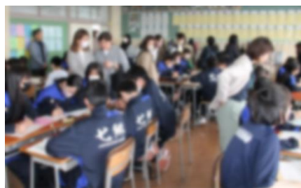
↑ 1-2 国語の授業

授業参観の後には、PTA総会が行われました。昨年度より、お互いに顔を合わせ、対面で会を進めることができるようになりました。総会では、PTA役員の方々のスムーズな進行により、滞りなく会が進み、様々な議事について承認を得ることができました。この会を経て、令和6年度のPTA活動が本格的にスタートすることとなります。今年一年もよろしくお祈りします。