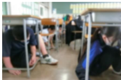
↑ 机の下に避難しています

5月1日(水)6校時に地震を想定した避難訓練が行われました。地震発生放送の後、まずは初動訓練として机の下に身をかがめ、安全を確保しました。今回は、長寿命化工事の影響で、避難経路が例年と違い、遠回りになるクラスもありましたが、整然と避難することができました。避難開始から全校の人数確認までの時間は約4分24秒でした。一部、話し声が聞こえた場面もありましたが、全体的には落ち着いて行動できており、防災への意識の高さがうかがえました。