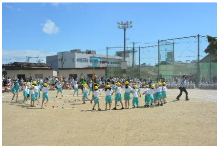
1年「おどってなげて! チェッコリ玉入れ」