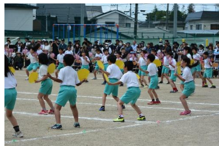
4年「2024新田すずめおどり」