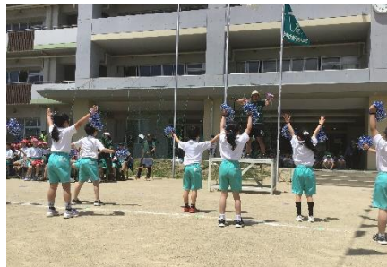
2年「2年生の大ぼうけん! ドラえもん2024」