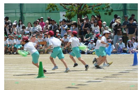
3年「ぐるぐる台風リレー2024」