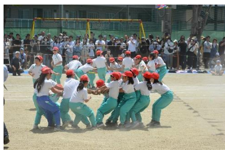
5年「Let's Go:Tug of War~綱取り合戦~」