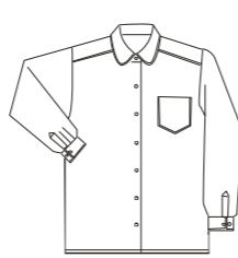
丸衿カッターシャツ