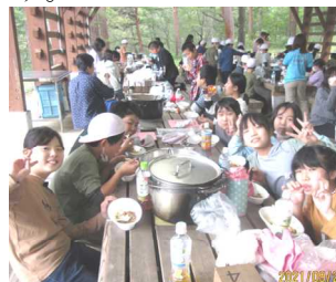
野外炊事カレーづくり