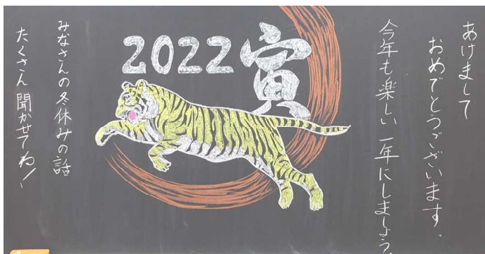
新年初日の教室掲示より

今年度は、さくら連絡網にて「教育目標等に関するアンケート」をお願いしました。例年と違う回答方法となりましたが、多くの皆様から回答を寄せていただきました。ありがとうございました。まだ回答がお済みでない場合でも、14日まで回答ができますのでよろしくお願いいたします。なお、このアンケートはきょうだいがいる場合にも、それぞれお子様ごとに回答していただくようになっております。どうぞよろしくお願いいたします。